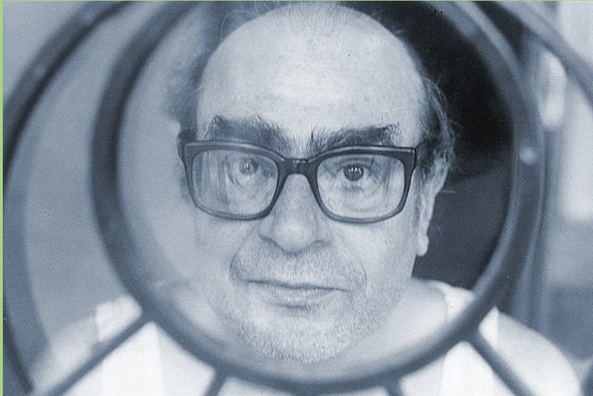
Fig. 1. Mario Levrero

El interés de Levrero por los estados hipnóticos no se limitó al plano teórico: según recuerda Montoya Juárez (2013), en su juventud llegó a considerar la posibilidad de formarse como terapeuta 4 y practicó la hipnosis con su hija para tratar dolencias físicas o psicológicas. Esta dimensión práctica confirma que la parapsicología no era para él un mero tema literario, sino un campo de experimentación vital vinculado a su búsqueda de autoconocimiento.