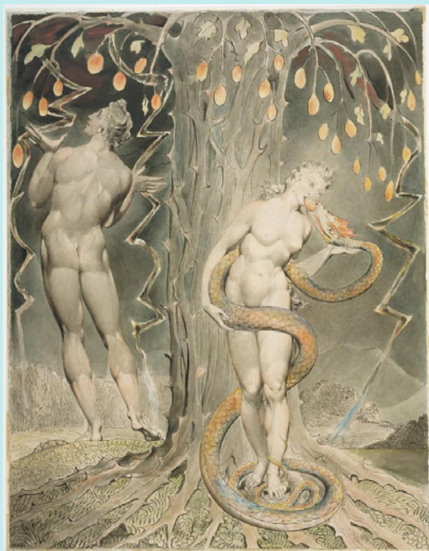
Fig. 3. A tentação e a queda de Eva , de William Blake