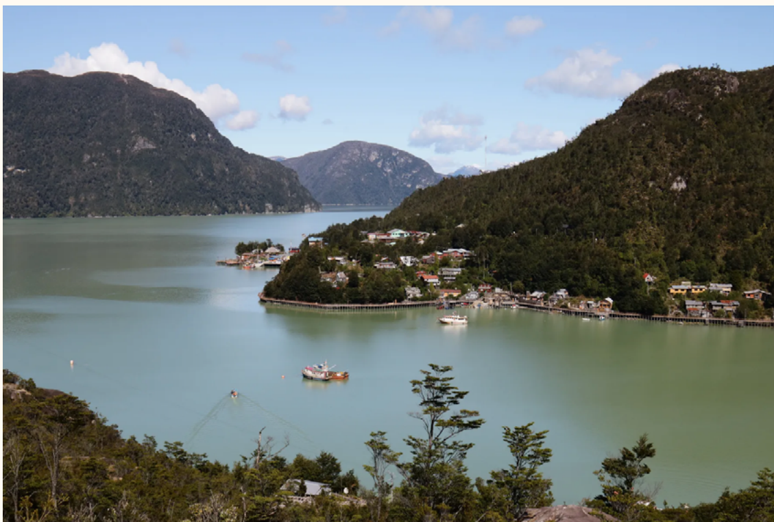
Figura 2. Por su clima difícil y enclave de aislamiento, los habitantes de Tortel recurren a la naturaleza para hacer su propia medicina

Caleta Tortel es una localidad ubicada en el delta del río Baker, la puerta de entrada a los fiordos de Patagonia occidental, límite meridional de la región de Aysén. Es un poblado donde los únicos medios para trasladarse en su interior son a pie, por pasarelas peatonales de ciprés, o por vía marítima, en lancha. En Caleta Tortel aún no hay sistema de alcantarillado y la ciudad más cercana se encuentra a tres horas en vehículo por el sinuoso camino de ripio conocido como Carretera Austral.