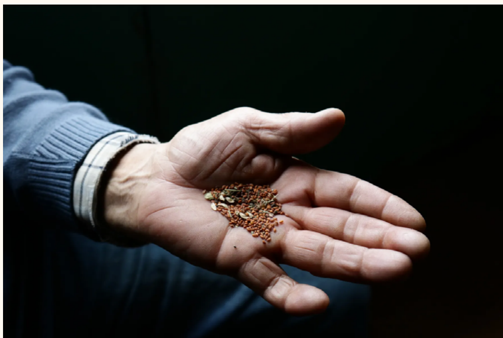
Figura 4. Semillas de mastuerzo se usan para «quebrar el empacho» en Caleta Tortel, región de Aysén, zona austral de Chile

Como las huellas secretas y no visibles sobre la meseta antártica de las protagonistas del relato «Sur», estos testimonios de sanación de mujeres del territorio austral de América remiten igualmente a una noción de no dejar rastro y, sin embargo, de elevada agencia respecto a la relación entre cuerpo humano y naturaleza. Así, en estos fragmentos de entrevistas, la noción de vacío e impresión sobre la corteza de un árbol opera como metáfora de una relación no intempestiva ni de conquista con el ambiente natural.