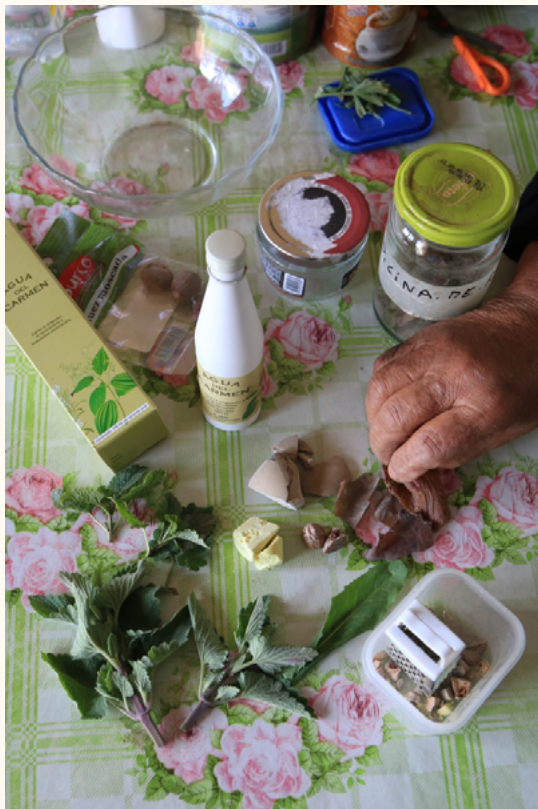
Figura 3. Hierbas medicinales, pero también azufre, buche de avestruz y piedra de guanaco se usan para hacer remedios en la región de Aysén, zona austral de Chile

El caso descrito remite a un ejemplo de curación por transferencia, en donde el estado de una hernia estomacal se replica a un elemento del ambiente natural externo: para este caso, el tronco del canelo, «el árbol más bonito que se encuentre», según Landeros. La operación consiste en tomar la medida del afectado (el pie del bebé) y luego «herir» al árbol más sano para que ayude, así, a curar al enfermo. La sanación del árbol está en directa relación con la cura de la persona afectada. Oreste Plath, en su libro Folklore médico chileno , recoge un testimonio similar de sanación de una mujer campesina de la zona costera de Chile, quien aprovecha los productos fármacos de la cultura tradicional marítima para sanar una hernia con el alga del cochayuyo.