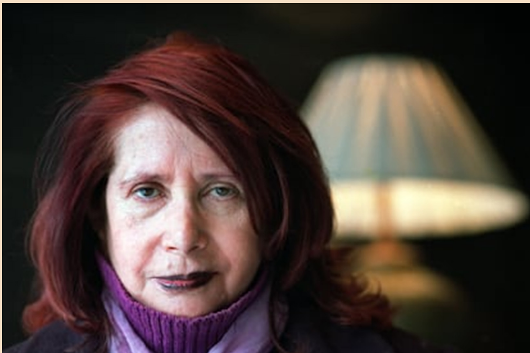
Fig. 2. Marosa di Giorgio