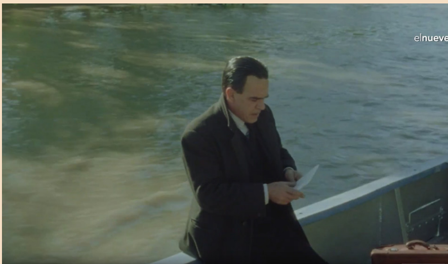
Fig. 2. El río en la adaptación cinematográfica de El astillero (David Lipszyc, 2000)

necesidad de intentarlo: «(...) necesitando entregarse sin reservas a todo aquello con el único propósito de darle un sentido y atribuir este sentido a los años que le quedaban por vivir y, en consecuencia, a la totalidad de su vida» (Onetti, 2023, p. 40). Si bien no hay una explotación laboral tan explícita como en el relato de Quiroga, esta está impregnada por la farsa a través del juego. El juego como una forma de arriesgarse ante la realidad, donde solo existen dos posibilidades: ganar o perder, pero siempre en relación con la vida de los personajes. Cayé jugó con los otros mensú y terminó perdiendo casi todo; intentó fugarse y perdió a su compañero, regresando a su antigua vida, quedando desolado existencialmente. Por su parte, Larsen participa de un juego sostenido por la simulación colectiva: Gálvez, Kunz, Petrus y los demás personajes, donde cada uno lucha contra la inutilidad de la empresa, aun sabiendo, en el fondo, que el esfuerzo es en vano. Cada personaje sigue su propia corriente, envuelto en una deriva. De alguna u otra forma, hay cierto mimetismo o metaforización de sus vidas con la del río.