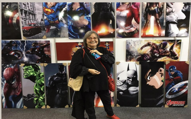
Fig. 1. Diamela Eltit

El filósofo Jacques Rancière (2009), en El reparto de lo sensible. Estética y política , reflexiona sobre la capacidad de los enunciados literarios de «tomar cuerpo», generando efectos de realidad en lugar de ser sus reflejos, en el sentido que le otorgaba el realismo tradicional. Lo empírico, argumenta, lleva las marcas de la realidad en la vivencia que ha dejado sus huellas experienciales, en tanto que lo poético nos muestra huellas «inscritas en la misma realidad y el artificialismo que monta máquinas de comprensión complejas» (Rancière, 2009, p. 47). Afirma, a partir de ello, que los enunciados literarios ejercen efectos concretos sobre la realidad, reconfigurando así el mapa de lo sensible que se hace visible por la propia capacidad de ser decible, concluyendo que «el hombre es un animal político porque es un animal literario, que se deja desviar de su destino ‘natural’ por el poder de las palabras» (Rancière, 2009, p. 50).